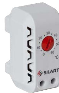
TBS-160 NC, 0 ... +60