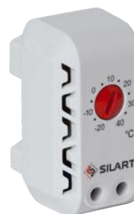
TBS-140 NC, -20 ... +40

Рекомендуемые термостаты для управления данным устройством